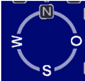
Drehen der Ansicht in die verschiedenen Himmelsrichtungen